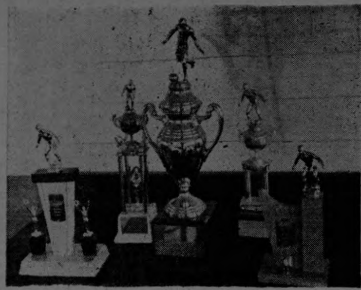
En el centro, Trofeo Rotativo donado por la Compañía Bananera al Campeón de Campeones de toda la División de Golfito. De izquierda a derecha: 1º Trofeo al Campeón, donado por todos los equipos participantes. 2º Trofeo al Sub-Campeón, donado por el Comité de Deportes de Coto. 3º Al equipo Campeón de Coto 1958/59. Este trofeo fue ganado por el equipo Ingeniería. 4º Sub-Campeón 1958/59, ganado por el equipo de Coto 47.