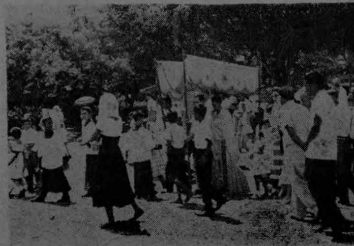
La presente gráfica nos señala el fervor religioso con que el pueblo de Palmar Sur acogió la celebración del día de Corpus Christi.