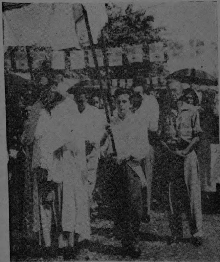
Todavía se oyen los comentarios de la celebración del Corpus Christi en Golfito, el jueves 28 de mayo. La calle, arreglada desde la madrugada por miembros de la Cofradía del Santísimo y otros ayudantes, lució con 6,000 banderitas formando un cielo sobre la calle, donde iba a pasar Jesús Sacramentado entre nubes de incienso y la fragancia de miles de pétalos de flores. Se vistieron como jardineras 110 niñas de los primeros grados y del Kinder, alistadas por sus maestras respectivas. Desfilaron también los Jocistas con las banderas nacionales, los jóvenes de la Pre-Joc, las Hijas de María todas uniformadas, miembros de la Legión de María, de la Cofradía, niños escolares con sus maestros y numerosos fieles que sobresalieron por su orden y devoción. Los altares en la plaza fueron artísticamente arreglados por el personal Docente de la Escuela Central, un grupo de señoras de la Zona Americana, el Departamento Marina y el taller. Se hizo un recuerdo cinematográfico a colores que esperamos verlo pronto a ver "como quedamos". En la foto se ve el Padre Bernabé llevando la custodia.