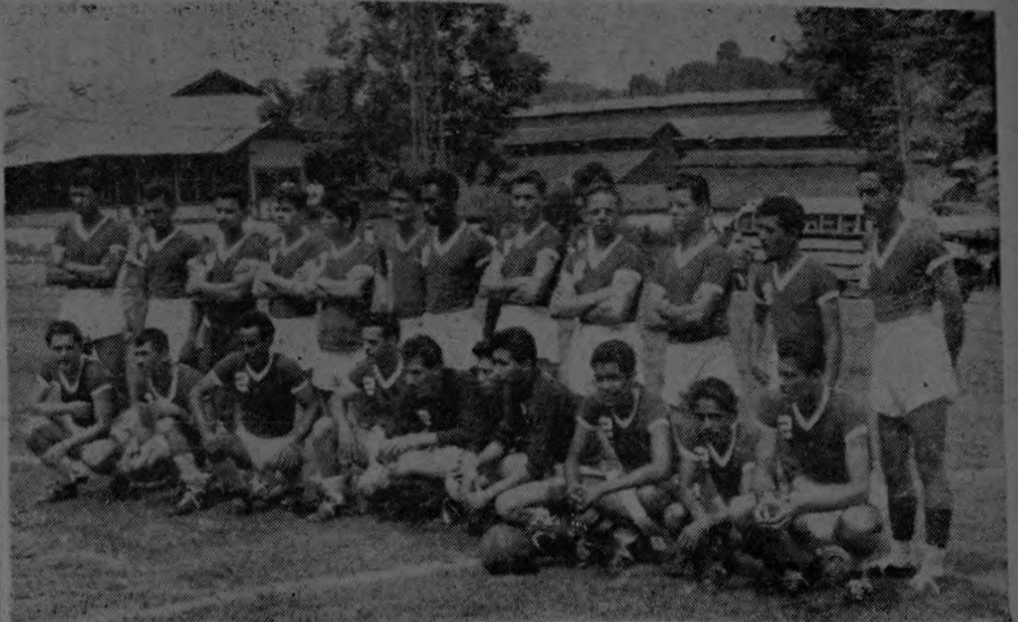
Este es el famoso cuadro SapriSSa del Sur, de Palmar que ha conquistado merecidos prestigios en las canchas abiertas y amuralladas del país y, en particular, en la Zona Bananera. Aquí está el cuadro tal como se hallaba al inaugurarse el estadio de futbol de la Bananera en Golfito, acto al que nos referimos extensamente en esta edición.